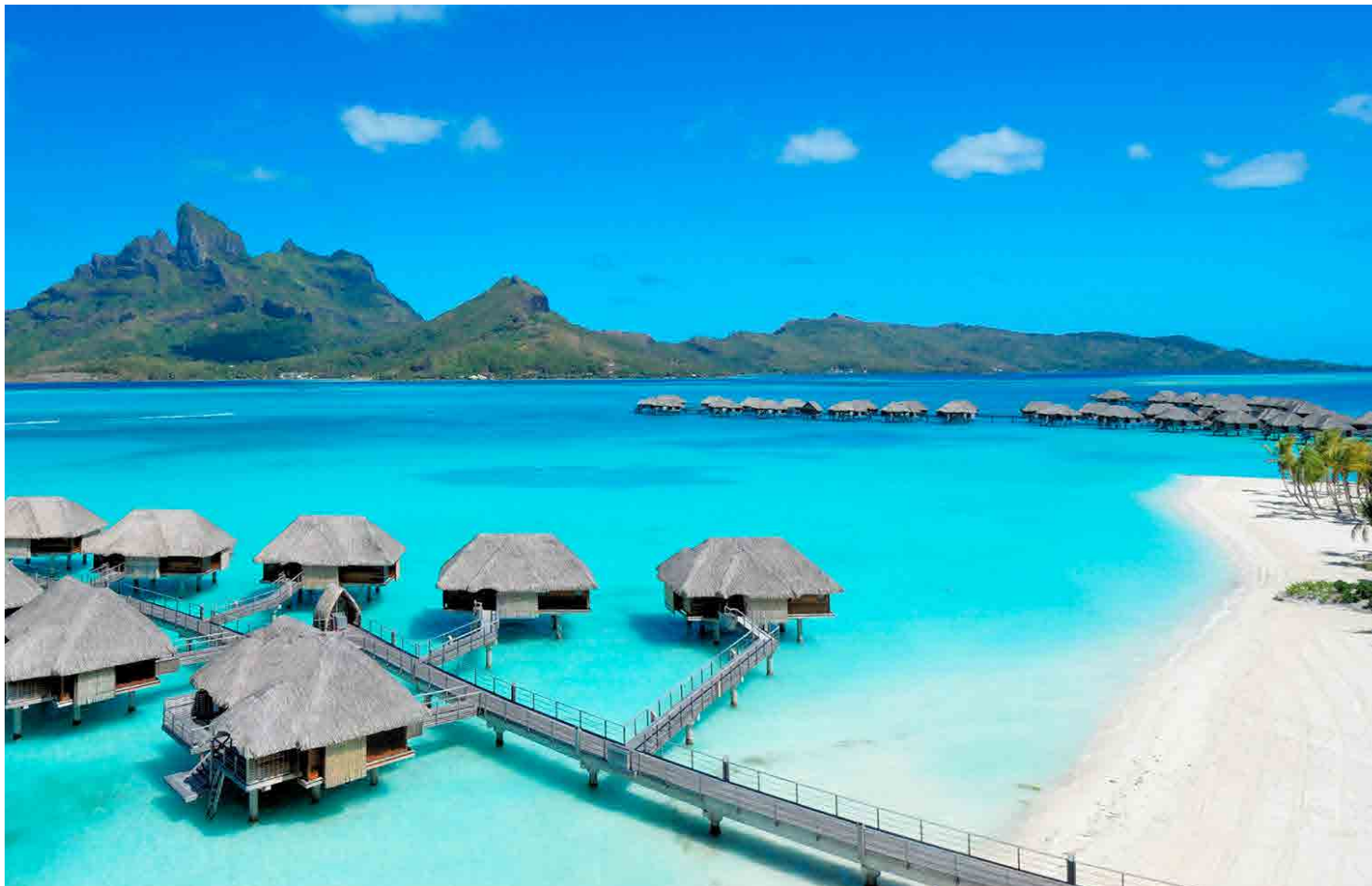
Bora Bora, French Polynesia

Four Seasons Resort Bora Bora est un paradis culturel, alliant la détente et la tranquillité du Pacifique Sud aux arts vivifiants de la Polynésie. Le complexe combine les normes de service les plus élevées avec la facilité naturelle et l'hospitalité gracieuse de la culture polynésienne. Les hébergements du complexe comprennent 100 overwater bungalows et sept beachfront villas, toutes conçues avec des toits de chaume et décorées d'œuvres d'art autochtones. Quatre restaurants, offrant une vaste sélection d'expériences culinaires créatives, sont complétés par des expériences culinaires en plein air. Un spa à service complet, équilibré par les rythmes puissants de l'océan Pacifique et la tranquillité isolée de la lagune de l'île. Offre une combinaison spectaculaire de détente et d'exaltation. Situé sur une étendue de 54 acres, le complexe répond à une vaste gamme de besoins et accueille une grande variété de programmes de divertissement.