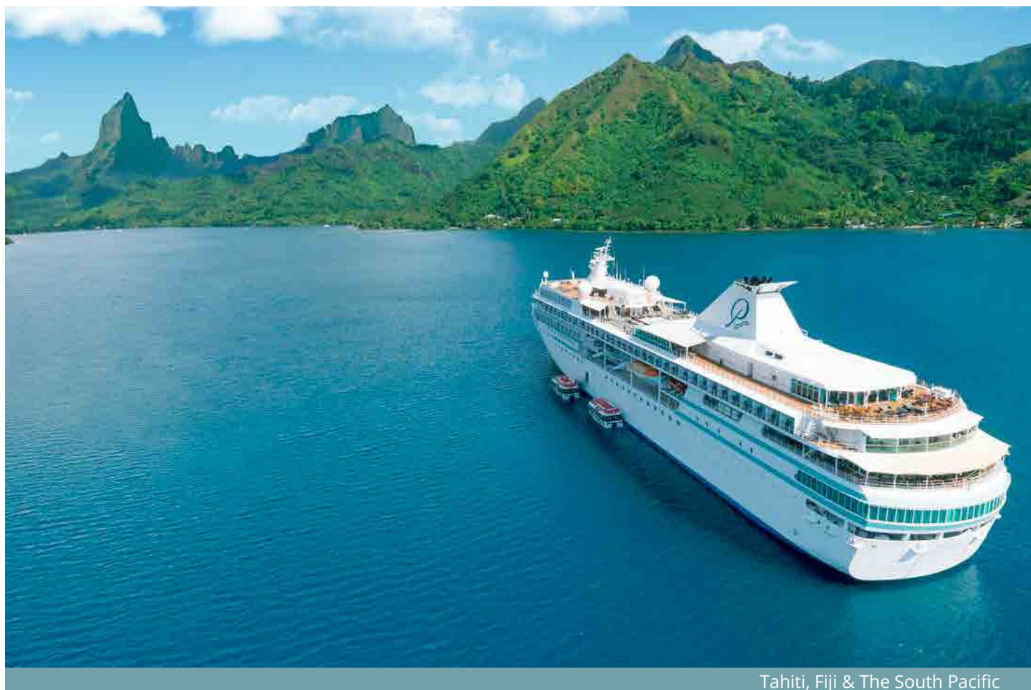
Tahiti, Fiji & The South Pacific

Paul Gauguin Cruises offre de petites croisières de luxe à des destinations idylliques à Tahiti, en Polynésie française, aux Fidji et dans le Pacifique Sud. Conçu spécialement pour naviguer dans les lagunes de la Polynésie française, le m / s Paul Gauguin est renommé et très haut classé comme meilleur navire de luxe, et à faire la plus longue navigation en continu dans le Pacifique Sud. Aucun autre navire de luxe dans l'histoire n'a offert ce niveau d'effort et d'expertise à destination unique l'année pour une période de temps aussi prolongée. Paul Gauguin Cruises est connu pour un service exceptionnel qui se distingue par l'hospitalité polynésienne et par l'un des meilleurs ratios d'équipage à invité en mer. Nos petites croisières de luxe incluent des chambres spacieuses avec vue sur mer, y compris des balcons dans certaines catégories de cabines, une cuisine gastronomique inspirée par l'un des meilleurs chefs de Paris, un somptueux spa avec des soins exclusifs, un vaste espace de terrasse et une piscine. Un centre de remise en forme, une boutique et un salon avec divertissements en direct. Le Gauguin propose également un port de plaisance pour le kayak, la planche à voile, le paddleboard et les programmes de plongée PADI SCUBA.