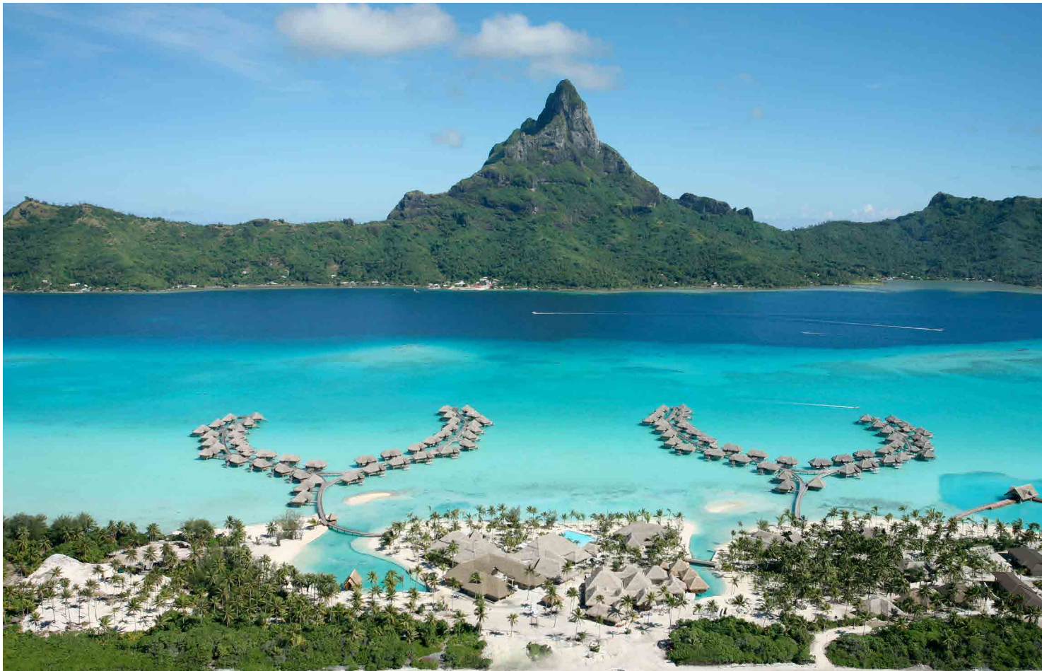
Bora Bora, French Polynesia