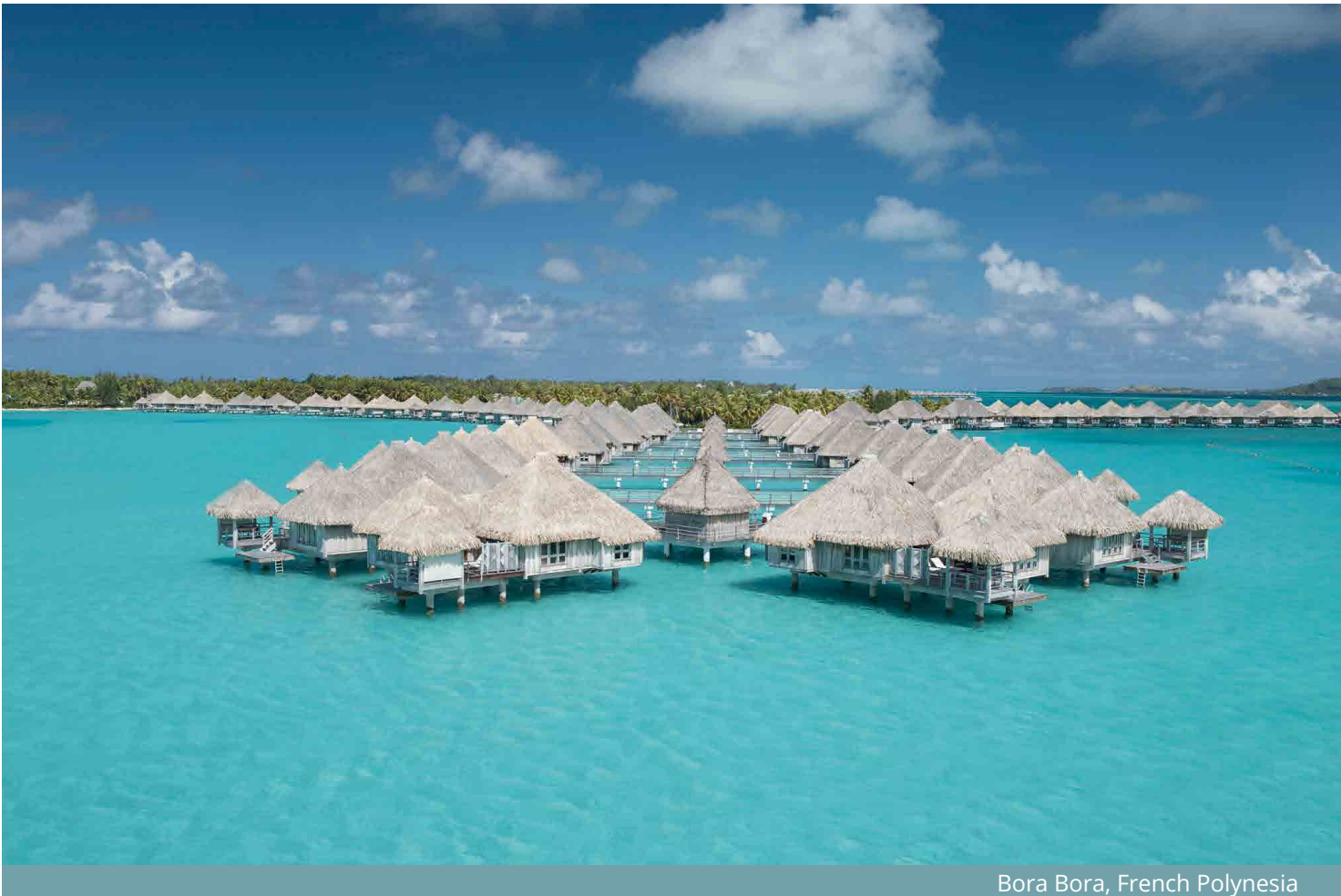
Bora Bora, French Polynesia

La dernière rénovation de la propriété à été faite en 2013. L'ajout d'un quatrième restaurant, Far Niente; Le rebranding du spa Miri Miri de Clarins et l'ouverture de la Boutique nuptiale exclusive étaient les autres changements importants qui se sont déroulés à cette époque. Depuis l'ouverture, l'entretien préventif toujours en cours est en place et plusieurs améliorations supplémentaires ont été réalisées, y compris de nouveaux rideaux occultants et de nouveaux meubles de plein air dans toutes les villas ainsi que de nouveaux meubles dans les restaurants.