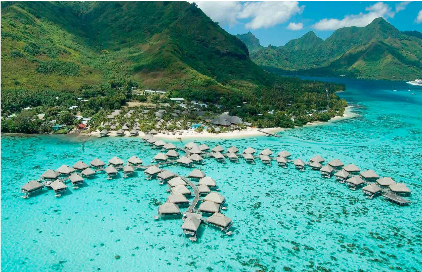
Moorea, French Polynesia

En un coup d'oeil: Le seul complexe 5 étoiles sur l'île de Moorea, des Overwater Bungalows les vues de couchers ou levers du soleil, les bungalows Overwater d'une taille généreuse comportent des sols en fond de verre, une piscine privée dans tous les Garden Bungalows, Garden Pool Bungalows interconnectés, Hôtel écologique, Crêperie & Bar unique sur l'eau, divertissement fantastique, danse de feu sur la plage trois fois par semaine. Les attractions incluent une plage de sable blanc immaculée, un magnifique lagon avec la meilleure plongée avec tuba à Moorea et des activités nautiques et Wi-Fi gratuit et mini-bar.