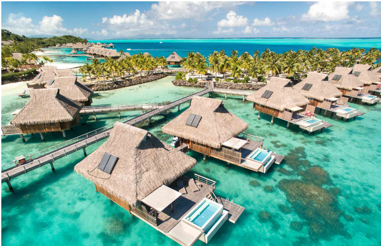
Bora Bora, French Polynesia

Situé sur une baie privée à Motu To'opua, Conrad Bora Bora Nui est une station idyllique isolée du reste de l'île. Des jardins tropicaux luxuriants, la plus longue plage de sable blanc de Bora Bora, des vues panoramiques sur l'eau et des couchers de soleil à couper le souffle vous y attend. Un court trajet en bateau de 20 minutes de l'aéroport et 45 minutes de vol de Tahiti. A A Glance: Complexe entièrement rénové avec des vues imprenables sur le coucher de soleil, vue sur la lagune et l'horizon de toutes les Villas, 114 Villas et Suites, dont 86 Overwater Villas, 18 Overwater Villas avec piscines à débordement, service de majordome. Deux présidentielles à 2 étages Overwater Villas, également avec service de majordome, spa Hilltop avec vue panoramique - utilisant les produits de soin de peau Elemis Spa, situé sur la plus longue plage de sable blanc de Bora Bora, accès privé à l'île privée Motu Tapu. Quatre destinations gastronomiques distinctes, y compris un overwater Sunset Lounge, piscine à débordement avec bar dans l'eau, terrain de golf miniature gratuit, sélection d'activités nautiques gratuites, Wifi gratuit et mini-bar inclus.